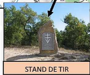
STAND DE TIR