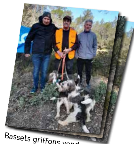
Basset griffons vendeen