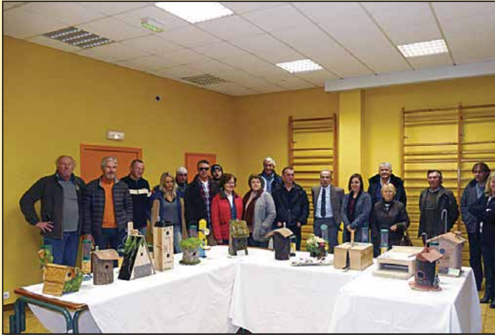
Exposition des treize projets de nichoirs et remise des prix à l’issue du concours

Après le succès de la journée du 18 octobre “Un dimanche à la chasse” et dans un but d’ouverture en direction du public, la société de chasse de Claviers a décidé de créer un groupement qui rassemblerait des chasseurs et des non chasseurs. Celui-ci, qui compte déjà près d’une quarantaine de membres s’est appelé “Les Amis des Forêts”. Ensemble, ils ont organisé, le 24 janvier, un concours du meilleur nichoir.